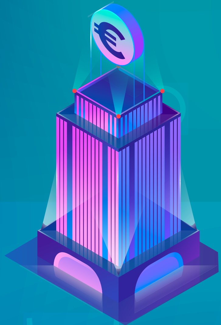
FONDO NAZIONALE INNOVAZIONE